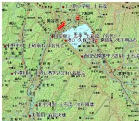
図-1 被害箇所分布 (牛山氏作成資料)