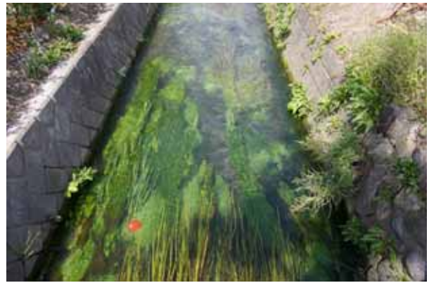
写真-4 郊外水路（征矢野川） 河床は砂礫で、水草が豊富である。