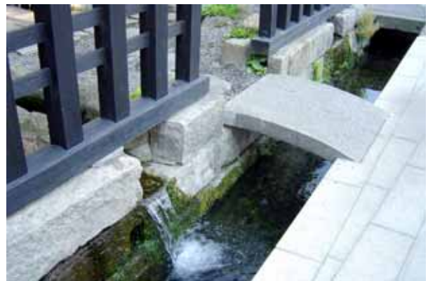
写真-5 市街地の水路（源智の井戸横の水路） 暗渠が連続し、所々水面が見える